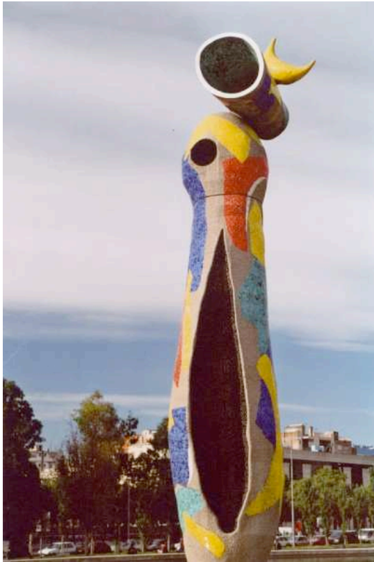
www.laresistance.ch (patrick sturm)